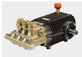
TW 500 Premium